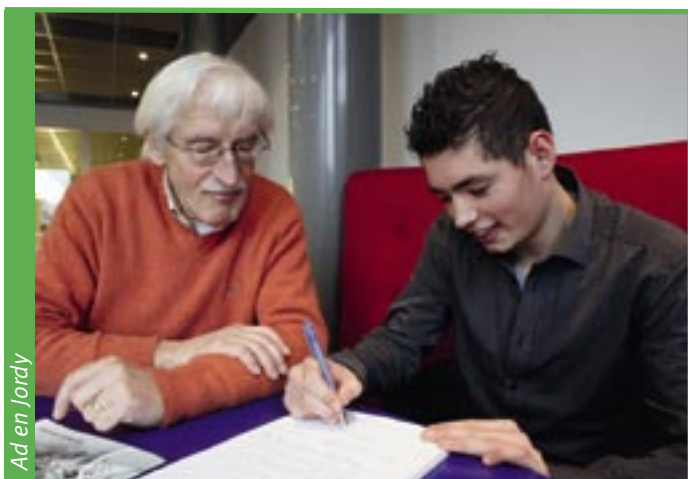
Ad en Jordy

S. is gemotiveerd om de dingen die niet goed gaan bij de kop te pakken. Daar kan een coach van KANS 050 hem goed bij helpen! ■