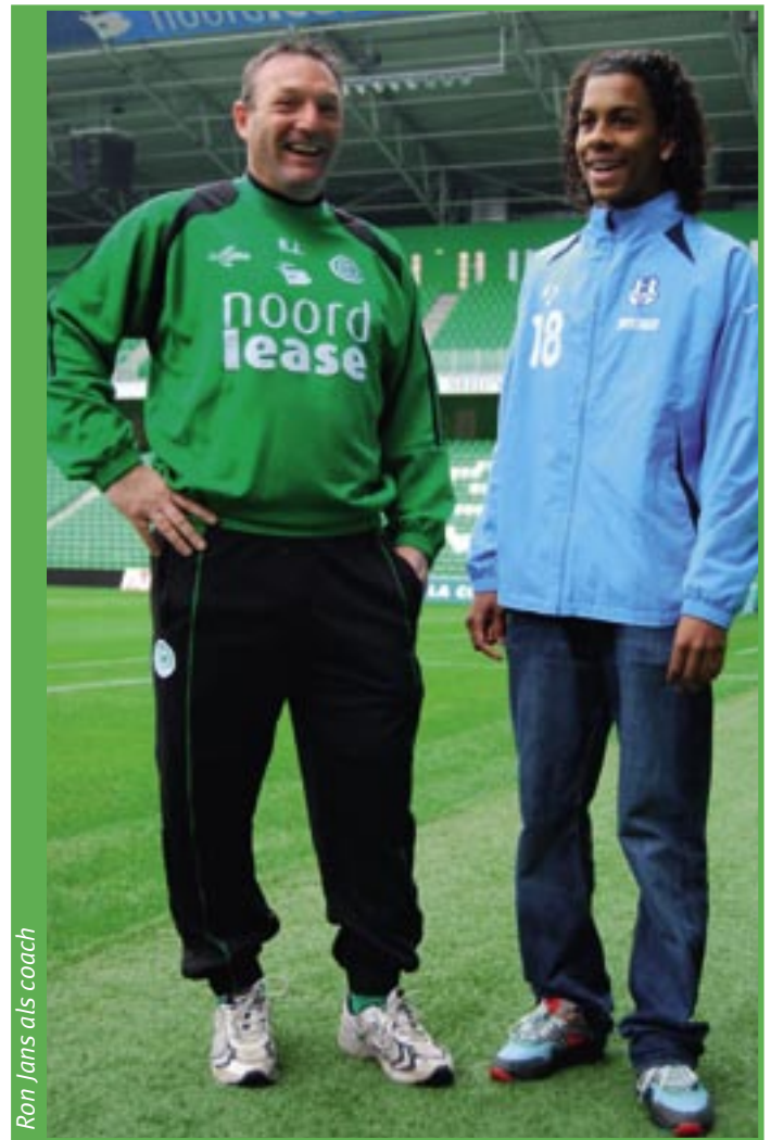
Ron Jans als coach